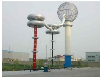
▲ 1200kV 0.5A