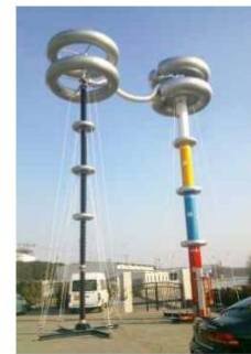
▲ 1600kV 0.5A