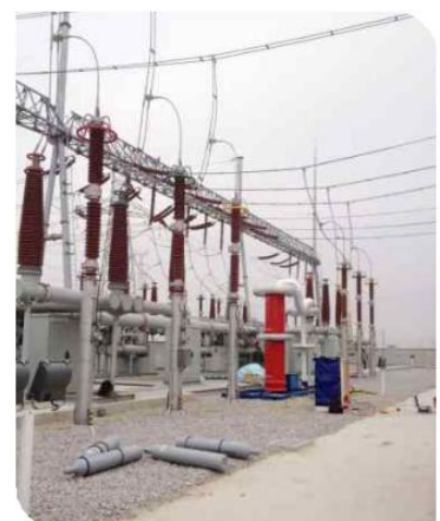
▲ 800kV 5A