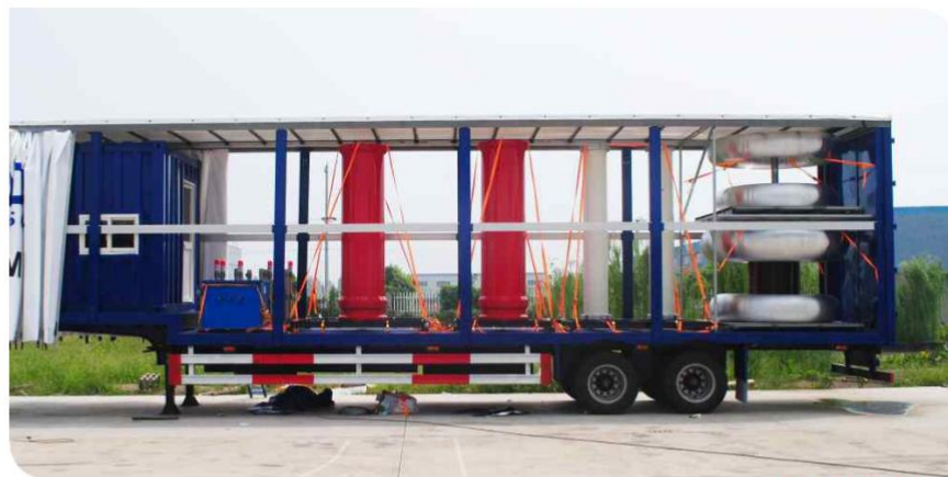
▲ 800kV 0.5A