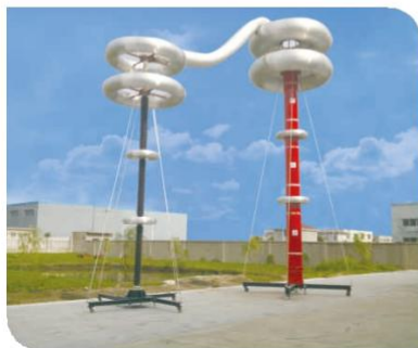
▲ 1200kV 0.5A