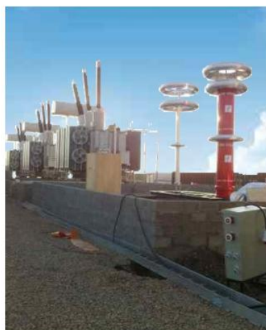
▲ 550kV 1A